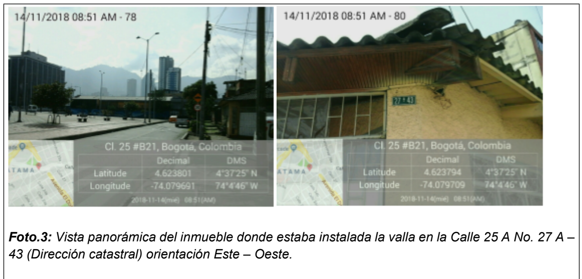
Foto.3: Vista panorámica del inmueble donde estaba instalada la valla en la Calle 25 A No. 27 A – 43 (Dirección catastral) orientación Este – Oeste.